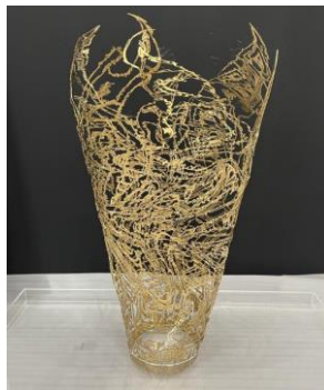
The Fountain of Life , 2019-2021 Hierro y pintura electroestática en polvo. 200 x 110 x 80 cm