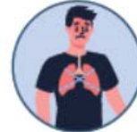
Sensación de falta de aire