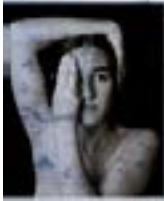
Actos de Fe #2 , 2003 Acetato y fotografía blanco y negro sobre metacrilato 100 x 70 cm