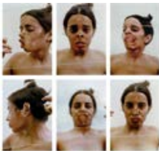
Untitled (Glass on Body Imprints), 1972-1997 6 c-prints color 40,5 x 50,5 cm c/u