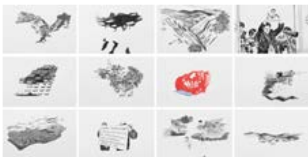
El viaje (serie) , 2005 12 dibujos, técnica mixta sobre papel 32 x 48 cm c/u