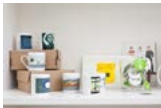
Tienda Museo LiMAC, 2002-2016

Objetos de merchandising : camisetas LiMAC, camisetas de artistas, gorras, bolsos, mouse pad, lápiz, borrador, agenda telefónica, cuaderno de notas, postales, kit museo de arte contemporáneo, souvenirs de la muestra "Living Room" (Volkswagen), muñecos, tapetes, platos, jarra LiMAC, pegatinas, pin y bolsas de tienda. Materiales y dimensiones variables