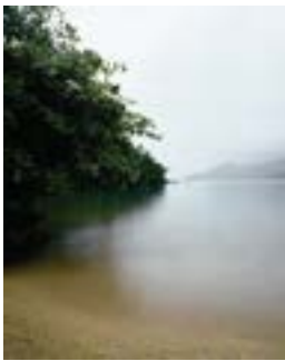
Mamanguá , 2007 Fotografía color 227 x 180 cm