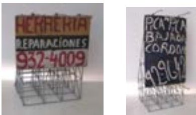
Publicidad, 2003 Instalación compuesta por una cabina con dos módulos de metal (43 x 35 x 42 cm / 71 x 33 x 48 cm), dos estantes de madera e instalación eléctrica