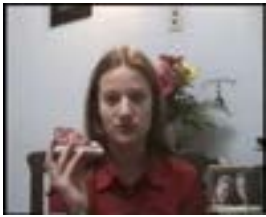
Sor Kitty: la monja misionera , 2001 Vídeo, color y sonido , 10'