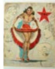
Sin título (mujer estrella), 2005 Tinta sobre revistas antiguas 31 x 25,5 cm