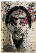
Cartografía Interior #35 , 1995 Acetato y fotografía blanco y negro sobre metacrilato 100 x 70 cm