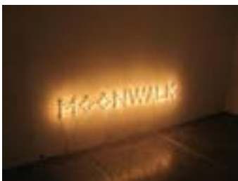
Moonwalk (At Rigo's Pace), 2006 Instalación, bombillas e instalación eléctrica 18 x 179 cm