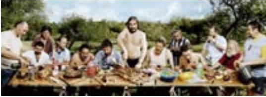
Asado criollo, 2003 Fotografía coloreada a mano 100 x 300 cm