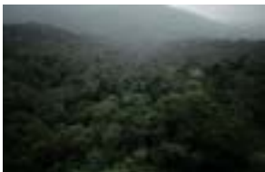
Mairiporã , 2006 Fotografía color 120 x 190 cm