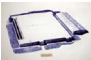
Figure 1728 , 2014 Bolígrafo sobre papel 152 x 203 cm