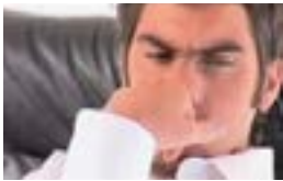
The Martín Sastre Foundation , 2003 Vídeo, color y sonido , 5'