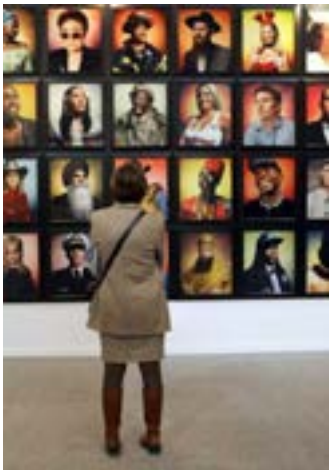
De la serie Des Américains , 2002-2004 Instalación, 52 fotografías color 68,4 x 58,2 cm c/u Dimensiones variables