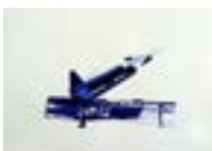
Nike Ajax 2 , 2012 Acuarela sobre papel 59 x 76 cm