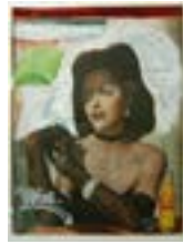
Sin título (fiichera), 2004 Tinta sobre revistas antiguas 29,5 x 22,5 cm