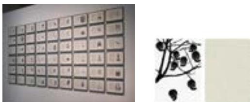
¿Por qué temer al futuro? , 2005 Juego de 54 naipes, serigrafía 29,5 x 41,5 cm c/u