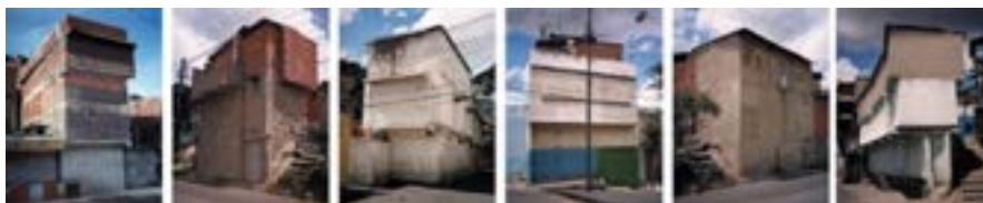
Residente pulido. Ranchos , 2003 6 fotografías color 200 x 150 cm c/u