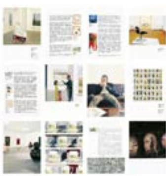
Visita Guiada (Catálogo LiMAC), 2003

Libro compuesto por ciento doce pinturas al óleo sobre papel de algodón 23 x 17 cm c/u