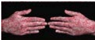
Actos de Fe #25 , 2004 Duratrans y caja de luz 66 x 154 cm