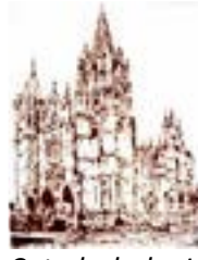
Catedral de León (serie Pictures of Chocolate), 2003