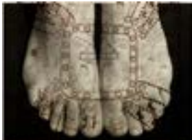
Actos de Fe #16 , 2003 Acetato y fotografía blanco y negro sobre metacrilato 108 x 125 cm