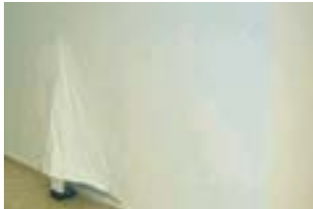
Santos Inocentes , 2003 Instalación compuesta por escultura de plástico, escayola y textil tratado con silicona y acrílico blanco Dimensiones variables