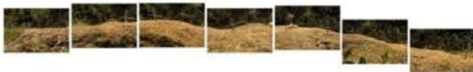
Campo Santo (Grupo B), 2006 Instalación, 7 fotografías color 104 x 960 cm (80 x 120 cm c/u)