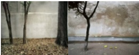
Sin título #4