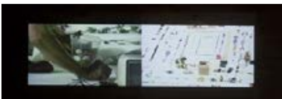
Una cosa es una cosa, 1990-2005 Vídeo-instalación, 2 canales de vídeo, color y sonido 27', 109 x 470 cm