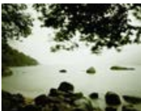
Mamanguá IV , 2008 Fotografía color 180 x 230 cm