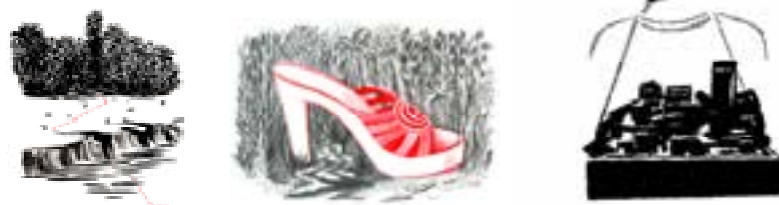
Selva (serie) , 2006 32 dibujos, técnica mixta sobre papel 25 x (25 x 35 cm) + 7 x (35 x 25 cm) c/u