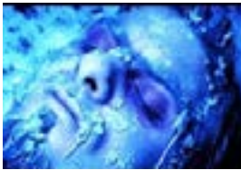
Videoart, The Iberoamerican Legend , 2002 Vídeo, color y sonido , 16'