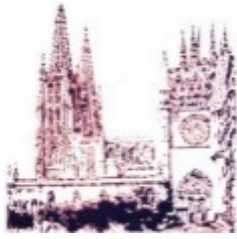
Catedral de Burgos (serie Pictures of Chocolate), 2003