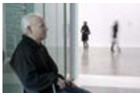
Desengaño -explicación visual- , 2010 Vídeo, color y sonido 7' 24''