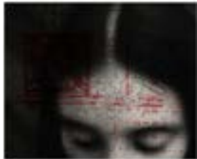
Actos de Fe #11 , 2003 Acetato y fotografía blanco y negro sobre metacrilato 108 x 125 cm