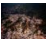
Cantareira , 2008 Fotografía color 21 x 29 cm