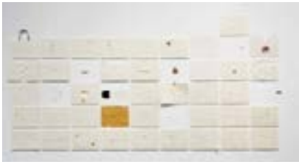
Vivir en un rectángulo , 2008 45 dibujos, técnica mixta sobre papel Dimensiones variables