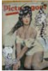
Sin título (disc parade), 2004 Tinta sobre revistas antiguas 30 x 22,5 cm