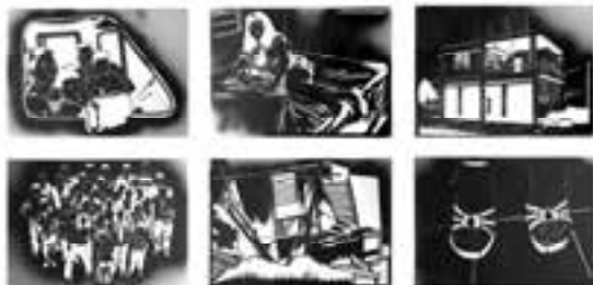
Lo que yo traigo no se vende en la marqueta , 2004 6 plantillas en lámina de acetato 50 x 70 cm c/u