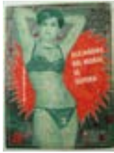
Sin título (Alejandra del Moral), 2005 Tinta sobre revistas antiguas 32 x 24 cm