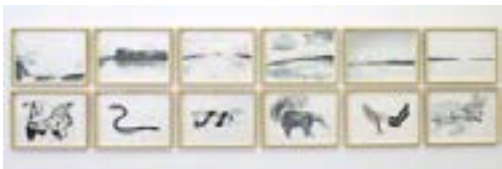
Historia natural (serie), 2006 12 dibujos, técnica mixta sobre papel 25 x 35 cm c/u