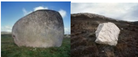
Sin título #3