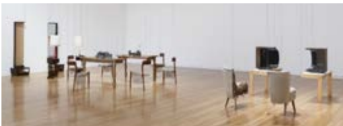
Living room partido, 2006 Instalación, espejo, mesa, monitor de TV y otros elementos Dimensiones variables