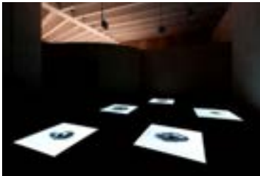
5 biografías-videos #3, 2002

Instalación, 5 canales de vídeo, color y sonido, 7'