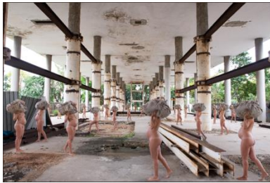
Retirantes, 2023 Serie Carregadoras Impresión en papel Rag Photographique 200 x 300 cm