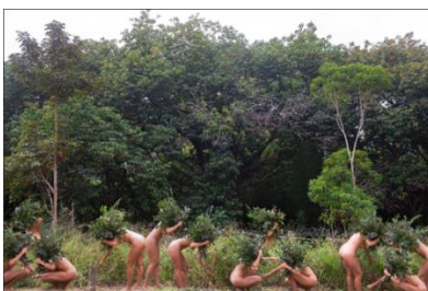
Erveira, 2023 Serie Carregadoras Impresión en papel Rag Photographique 200 x 300 cm