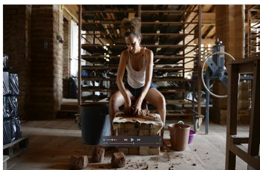
87'33'', 2023 Videoinstalación (vídeo, sonido, cerámica, hierro) Dimensiones variables