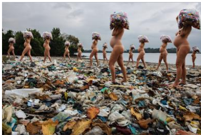
Carregadoras (P.S. 01), 2023 Serie Carregadoras Impresión en papel Rag Photographique 100 x 150 cm