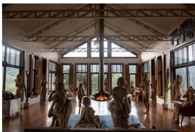
Matriz, 2023 Serie Carregadoras Impresión en papel Rag Metallic 200 x 300 cm