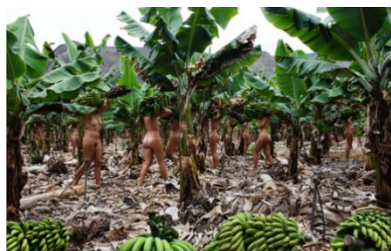
Carregadoras (P.S. 02), 2023 Serie Carregadoras Impresión en papel Rag Photographique 100 x 157 cm