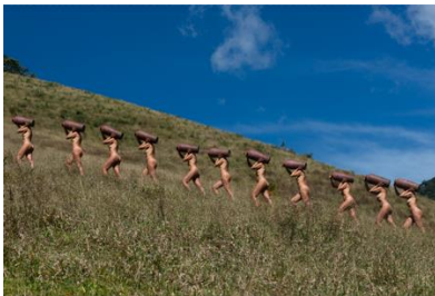
Moringa, 2023 Serie Carregadoras Impresión en papel Rag Photographique 133 x 200cm