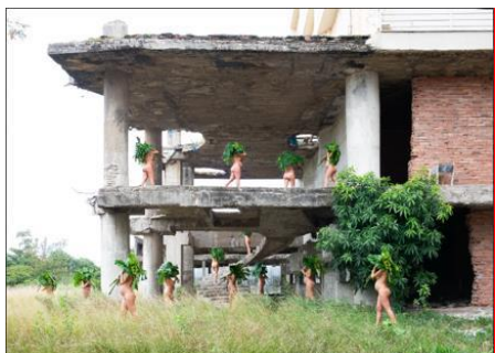
Costela, 2023 Serie Carregadoras Impresión en papel Rag Metallic