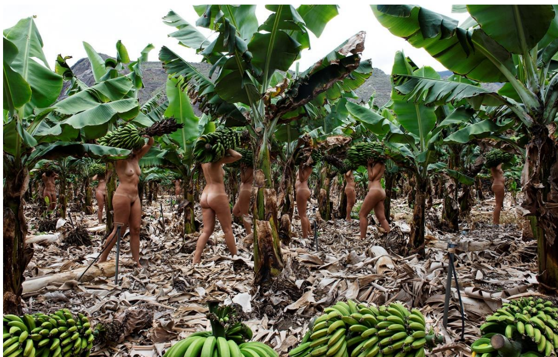
©Paula Scamparini. Carregadoras PS2 (série Carregadoras ), 2023