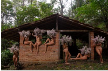
Noiva, 2023 Serie Carregadoras Impresión en papel Rag Photographique 135 x 200 cm