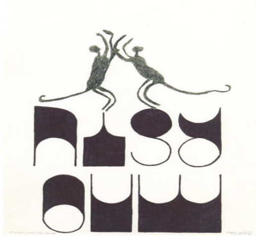
Serie Sin Título (I), 2015. Técnica mixta, 41 x 32 cm.